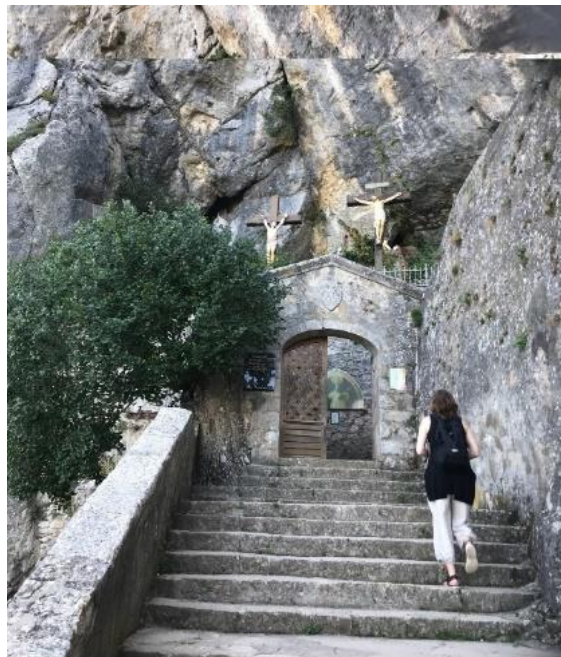
På väg upp till grottan

Vi besöker den grotta på en plats uppe på berget där Maria Magdalena sägs ha levt senare delen av sitt liv. Därifrån har man en hänförande utsikt och vandringen upp dit är underbar. Det är en fantastisk upplevelse att besöka denna plats och i grottan är också ett vackert kapell till hennes minne är inrymt. Där genomför vi en meditation. De som vill hinner göra ytterligare en vandring i den vackra naturen vid berget. På vägen dit besöker vi den närbelägna staden Saint-Maximin där en stor katedral finns. I denna minneskyrka vilar hon i en krypta med sina medresenärer och en förgylld skalle sägs vara hennes.