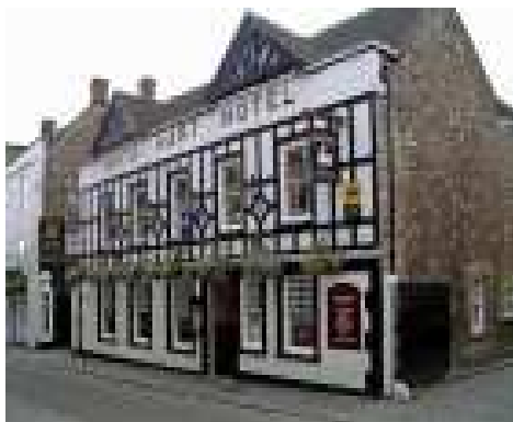
The White Hart Hotel

The White Hart Hotel där vi också har våra seminarier och intar förmiddagskaffe. Charmigt korsvirkeshus från 1400-talet med sällskapsutrymmen, konferensrum och restaurangen Sadlers som har ett brasserie och serverar lokala engelska specialiteter. Visit The White Hart Hotel website