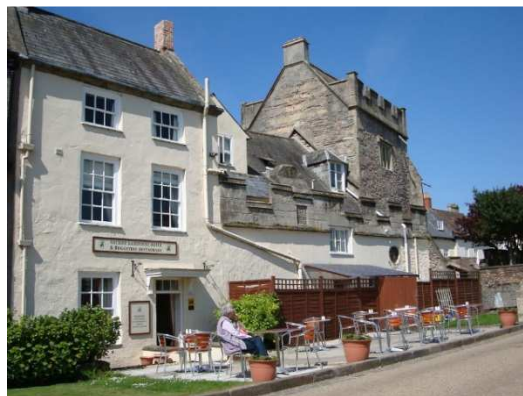
Ancient Gate House

Ancient Gate House ligger tvärs över gatan. Detta hotell är också mycket gammalt från 13/1400-talet och har bevarat många äldre byggnadsdetaljer. Det ligger vid gräsmattorna nära katedralens västra ingång. Hotellet har också en restaurang, Rugantino's som serverar italiensk mat.